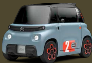
MY AMI POP

Για ακόμη περισσότερες δυνατότητες εξατομίκευσης, 2 ειδικές εκδόσεις είναι διαθέσιμες: My Ami POP και My Ami TONIC. Οι συγκεκριμένες εκδόσεις διαθέτουν επιπλέον ειδικά στοιχεία εξοπλισμού όπως διακοσμητικά στην μπροστινή μάσκα, διακοσμητικό περίβλημα στα φώτα, προστατευτικά στους προφυλακτήρες, εξωτερικά αυτοκόλλητα και διακοσμητικές μπάρες οροφής. Η τοποθέτησή τους πραγματοποιείται από επαγγελματίες πριν την παράδοση του αυτοκινήτου.