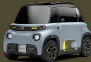
MY AMI TONIC