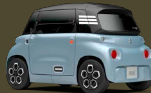
MY AMI GREY