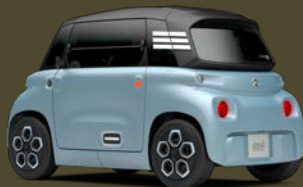
MY AMI BLUE