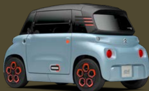
MY AMI ORANGE